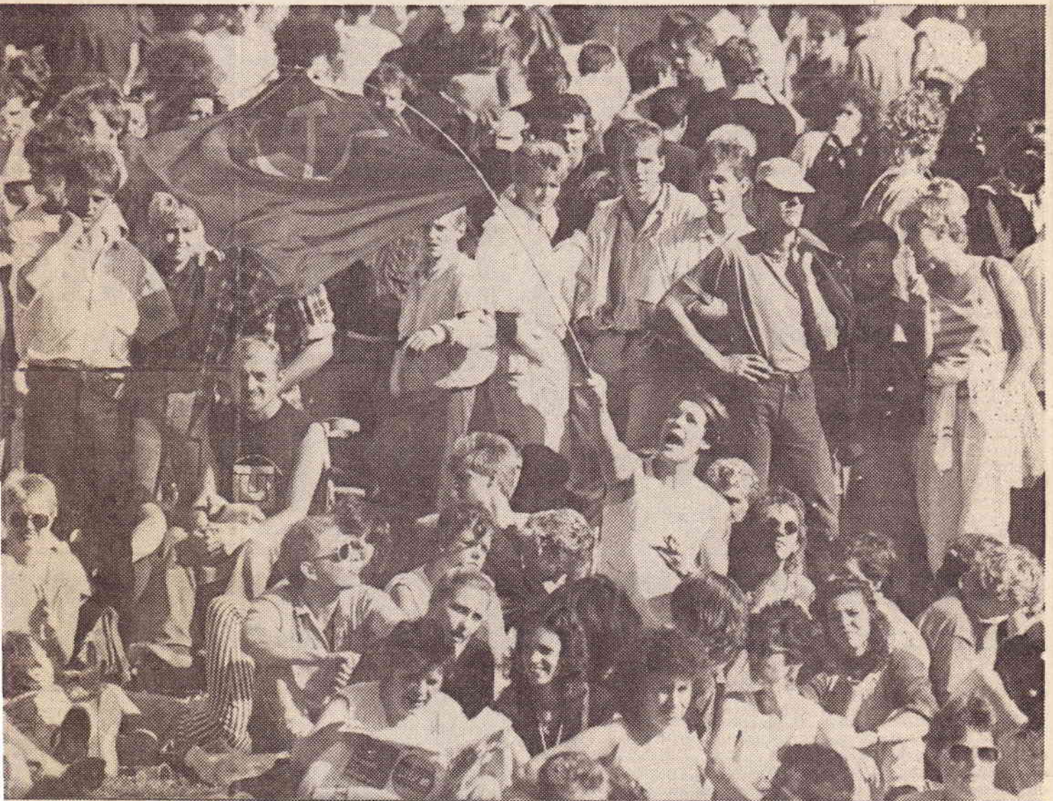
emidden van het nog wat stille publiek een vlaggezwaaiër, die zijn voorkeur voor het Oostblok duidelijk laat blijken.